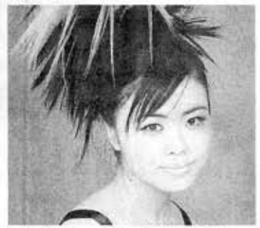
La pianista giapponese Hiromi il 10 luglio a Tortona